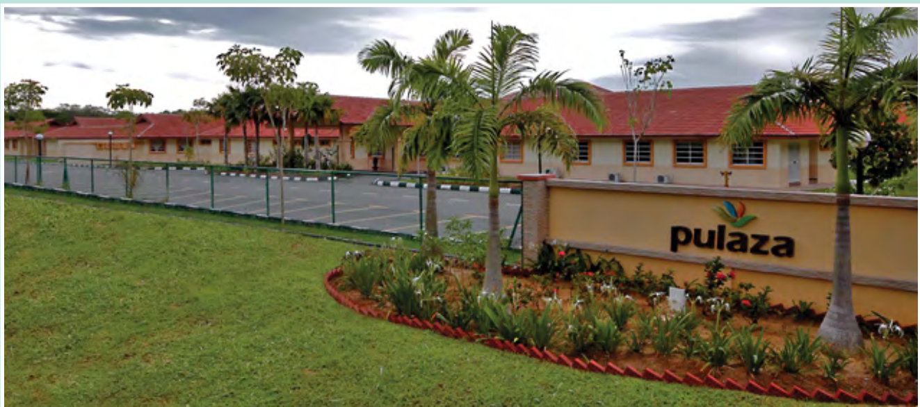
Pusat Latihan Zakat ZPP, Jalan Pantai Aceh Balik Pulau dijadikan Stesen Kuarantin Covid-19