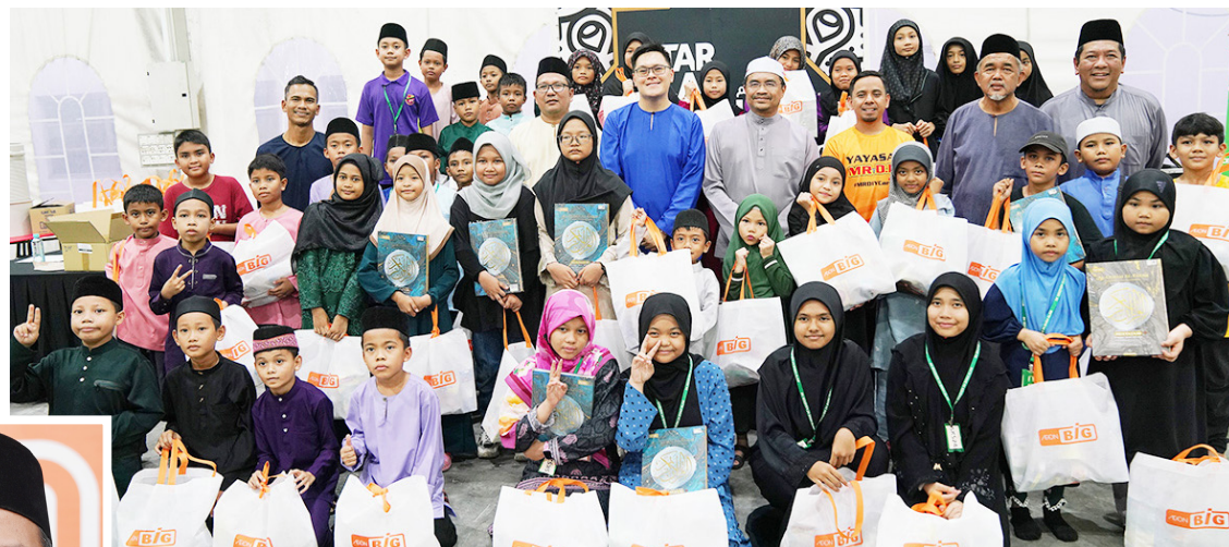
AEON BiG meraikan anak yatim dan golongan asnaf ketika program Iftar Ala Madinah@Karangkraf, pada Selasa.